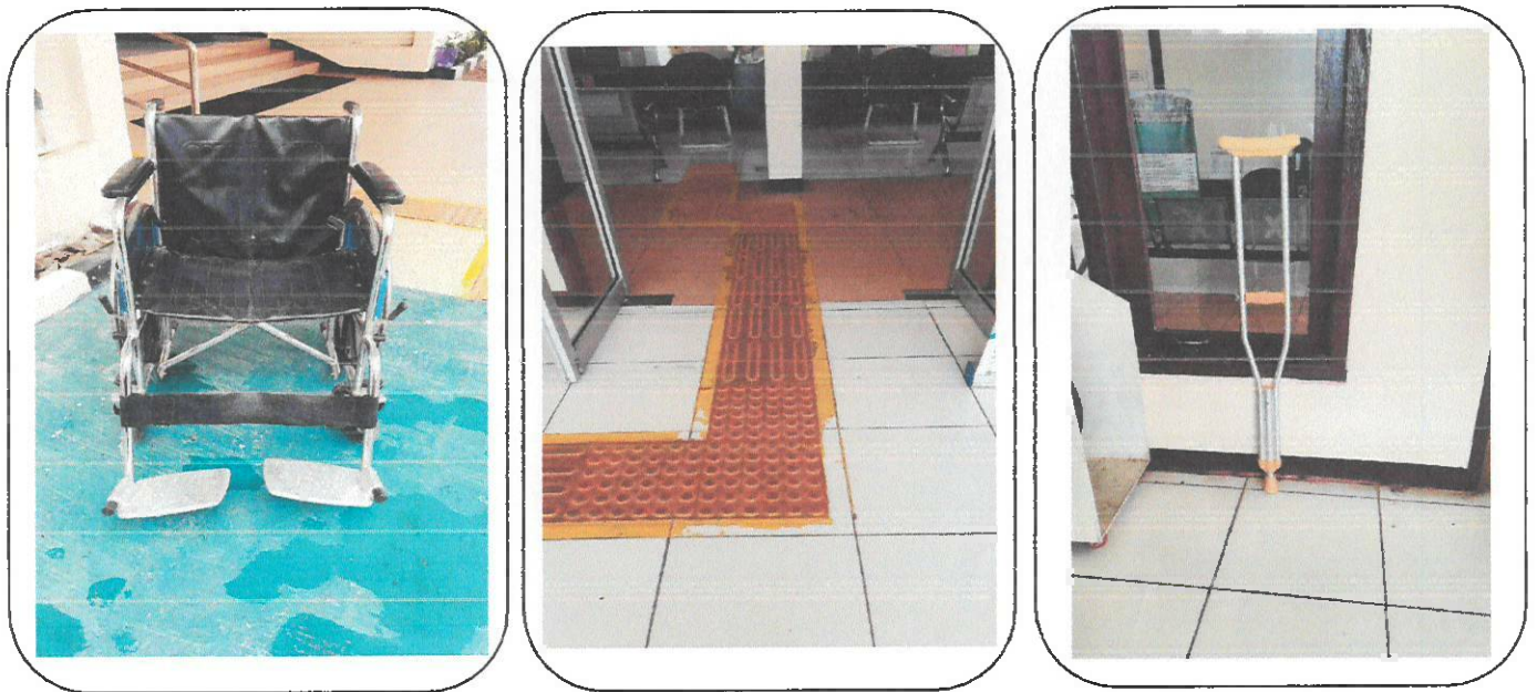
Foto : Fasilitas Bagi Pengunjung Disabilitas

Faktor penyebab sarana dan prasarana masuk kedalam 3 (tiga) nilai terendah antara lain karena gedung pengadilan masih berstatus pinjam pakai milik pemerintah daerah setempat, sehingga mengalami keterbatasan dalam pelaksanaan kelengkapan sarana dan prasarana di Pengadilan Negeri Meureudu, namun sampai dengan saat ini Pelaksana layanan berusaha menyediakan sarana dan prasarana bahkan untuk pengguna layanan disabilitas;