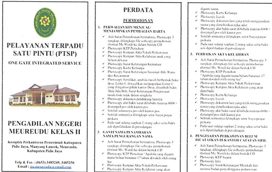
Foto : salah satu brosur tentang persyaratan layanan