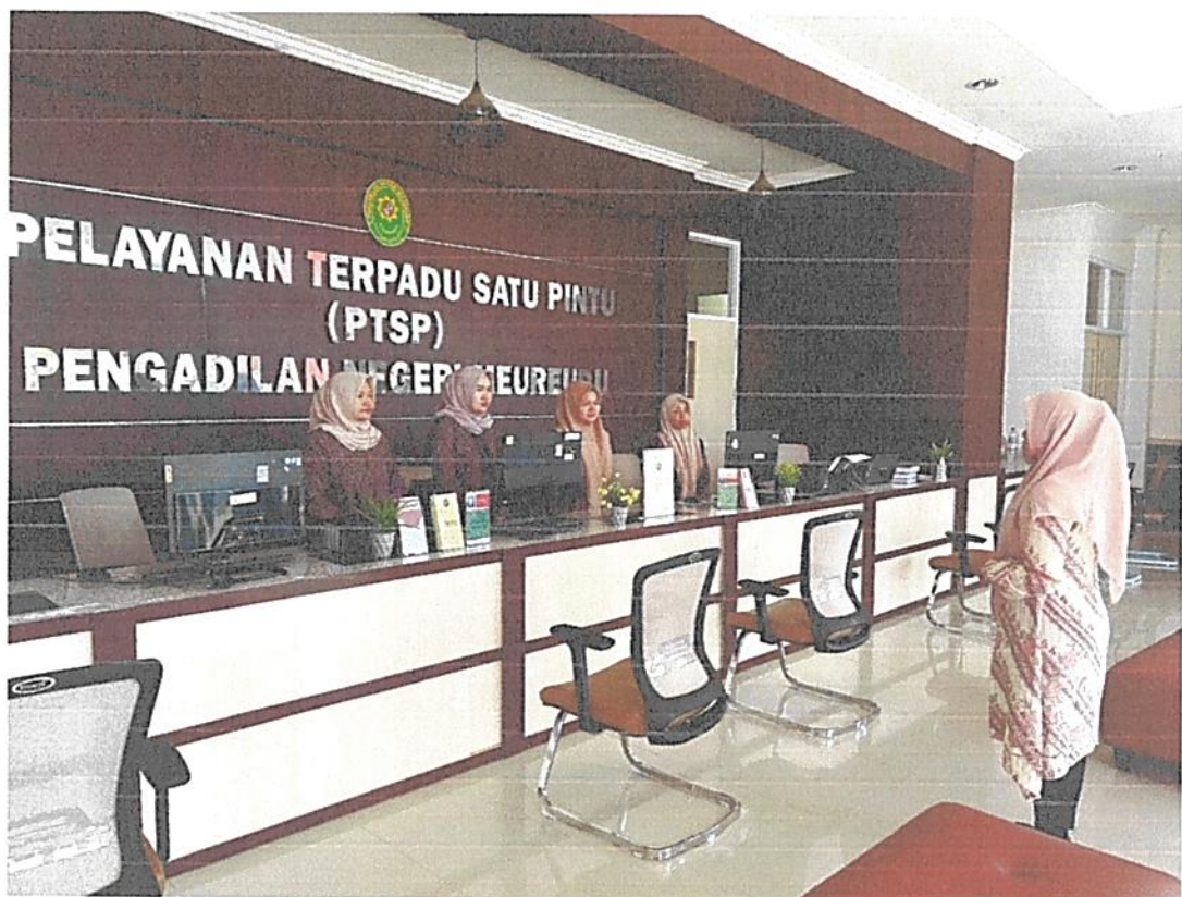
Foto : Briefing yang dilakukan setiap hari kepada Petugas PTSP

Faktor penyebab kompetensi pelaksana masuk kedalam 3 (tiga) nilai terendah antara lain kurangnya pemahaman, tentang aturan-aturan maupun SOP pada petugas layanan di Pengadilan Negeri Meureudu dalam memberikan pelayanan kepada pengguna layanan, untuk itu perlu dilakukan pelatihan secara berkala kepada petugas layanan untuk menambah ilmu maupun kecakapan dalam menghadapi pengguna layanan sehingga memudahkan petugas pelayanan dalam menyampaikan informasi maupun layanannya kepada penerima layanan. Di Pengadilan Negeri Meureudu briefing setiap hari dilakukan kepada Petugas PTSP oleh para Panmud maupun Kasubbag untuk dapat mengingatkan kembali tentang standar pelayanan;