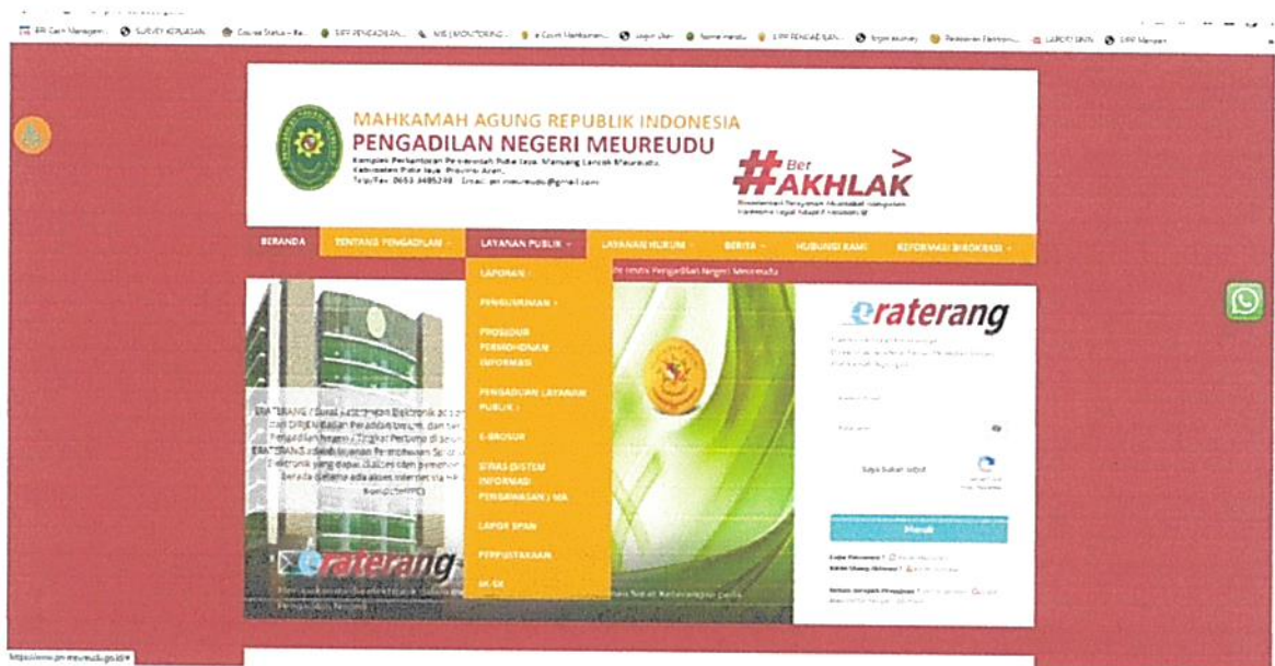
Foto : Informasi tentang persyaratan layanan pada Website

Faktor penyebab persyaratan pelayanan pelayanan masuk kedalam 3 (tiga) nilai terendah antara lain karena kurangnya sosialisasi bagi pengguna layanan terhadap Persyaratan layanan yang berlaku pada Pengadilan Negeri Meureudu, sehingga terkadang pengguna layanan menjadi tidak paham akan persyaratan layanan yang akan digunakan. Oleh karena itu diharapkan kepada petugas pelayanan memberikan edukasi bagi pengguna layanan di Pengadilan Negeri Meureudu baik secara lisan ataupun melalui media website, brosur, dsb. Agar pengguna layanan di Pengadilan Negeri Meureudu mendapatkan informasi dan paham terkait persyaratan layanan yang akan digunakan sesuai dengan aturan perundang – undangan serta SOP layanan.